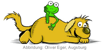
Abbildung: Oliver Eger, Augsburg