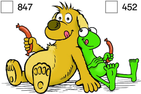
Abbildung: Oliver Eger, Augsburg