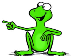
Abbildung: Oliver Eger, Augsburg