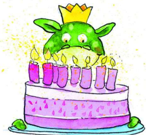
Abbildung: Sven Leberer, Altenberge

Sie sagen: „ Wir wünschen dir alles Liebe zum Geburtstag.“