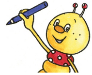
Abbildung: Bettina Reich, Zwenkau/Leipzig